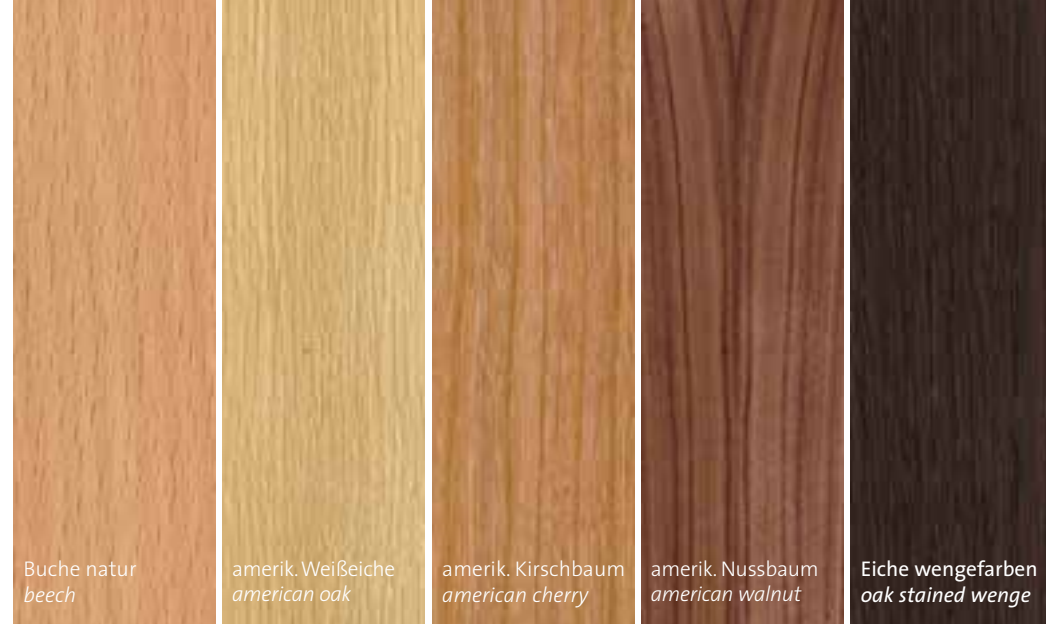
Echtholz furnier / veneer