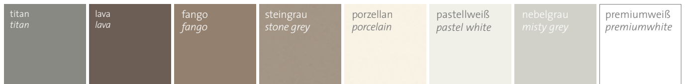
Uni Dekor (Auswahl)