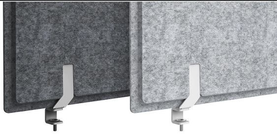
Tischplattenklemme für 19-25 mm Platten