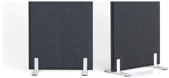
Doppelfußausleger bei Breite 700 mm