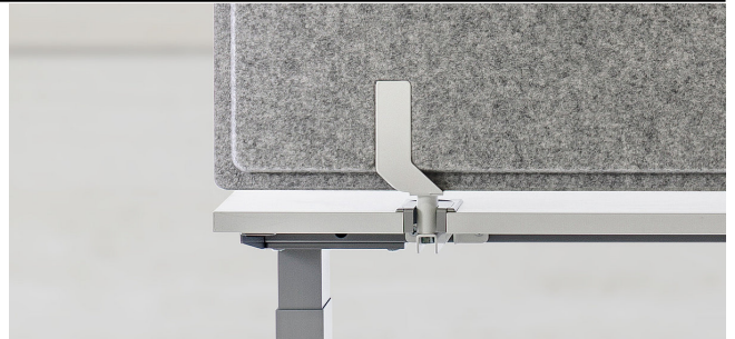
Befestigung an STAGE SX