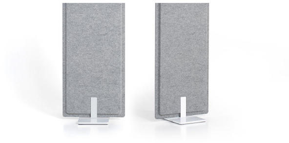
Bodenplatte bei Breite 410 mm