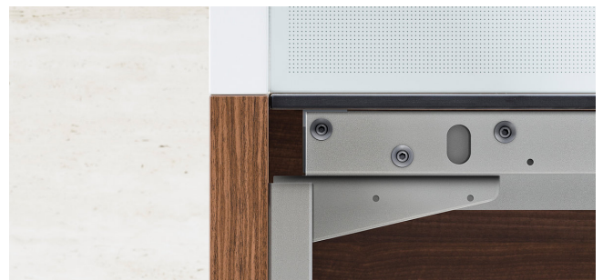
50 mm Seiten- und Rückwände