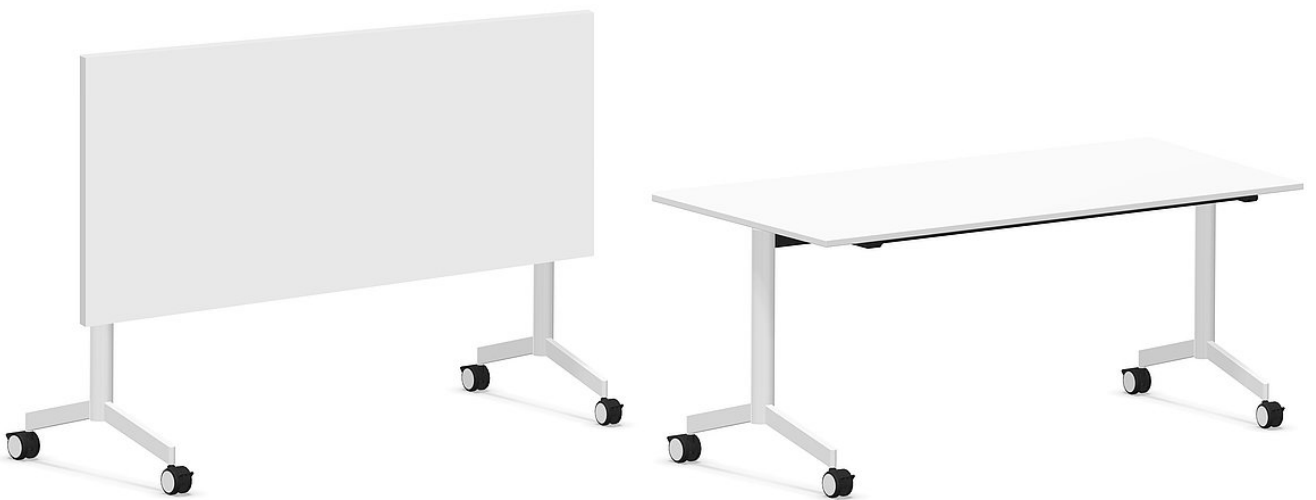
VARIO MOVE höhenfix