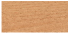
Buche Dekor hell