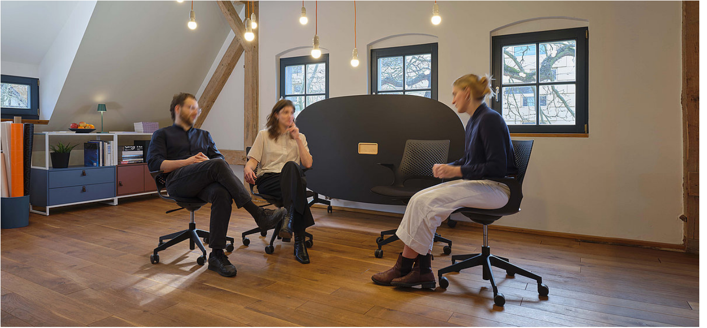
VARIO MOVE höhenfix