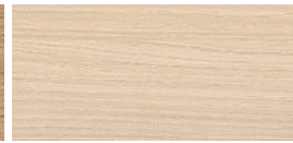
Akazie Dekor hell