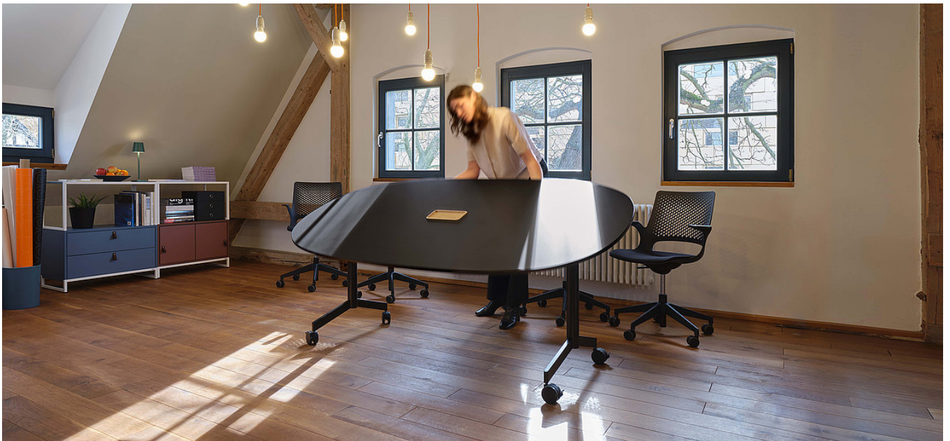
VARIO MOVE höhenfix