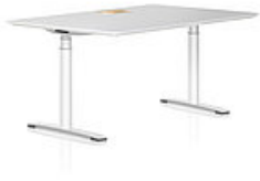
HAIMISH Sitz-/ Stehtisch