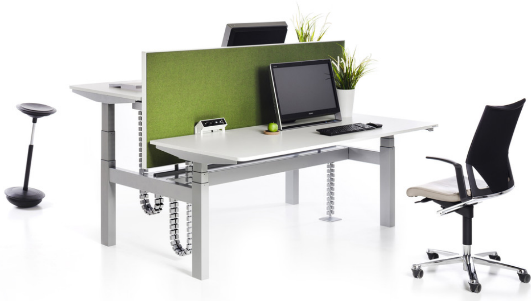
VARIO DUO 22 , Doppelarbeitsplatz mit feststehender S40 Sichtblende