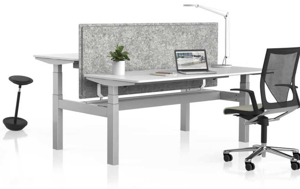
VARIO DUO 22 , Doppelarbeitsplatz mit feststehender PET PORT Sichtblende