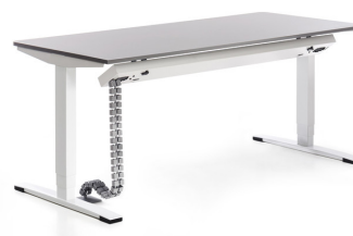
Kabelwanne innen geöffnet