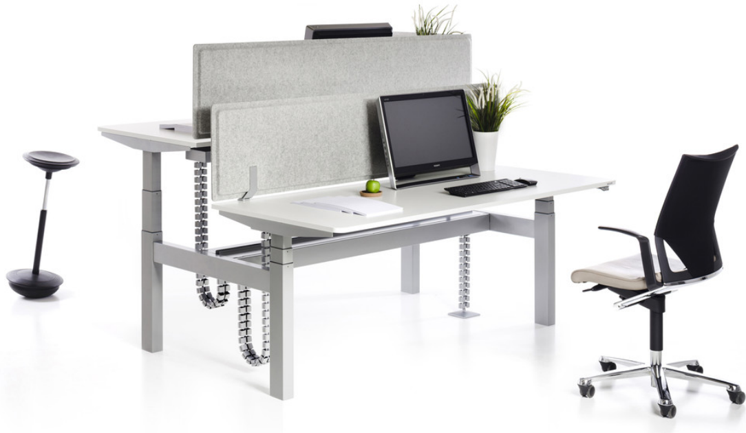
VARIO DUO 22 , Doppelarbeitsplatz mit beweglichen PET PORT Sichtblenden