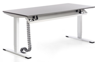
Kabelwanne außen geöffnet