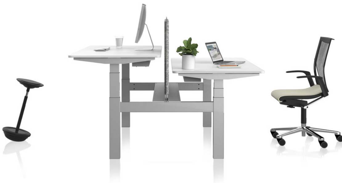
VARIO DUO 22 , Doppelarbeitsplatz mit feststehender PET PORT Sichtblende