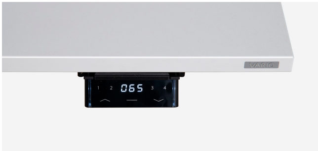
Höheneinstellung mit Memory/Display