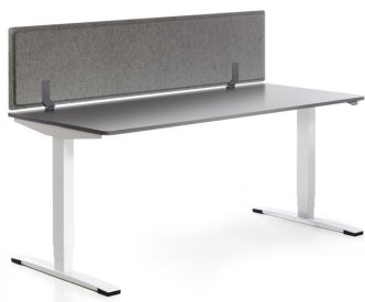
PET PORT Sichtblende