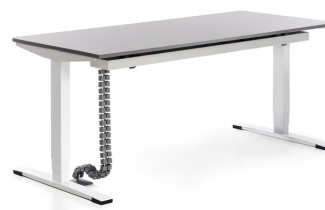
Kabelwanne mit Kabelkette