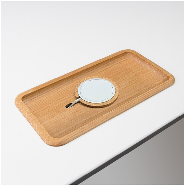
Ablageschale für MagSafe