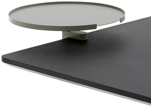
Runder Tisch D280