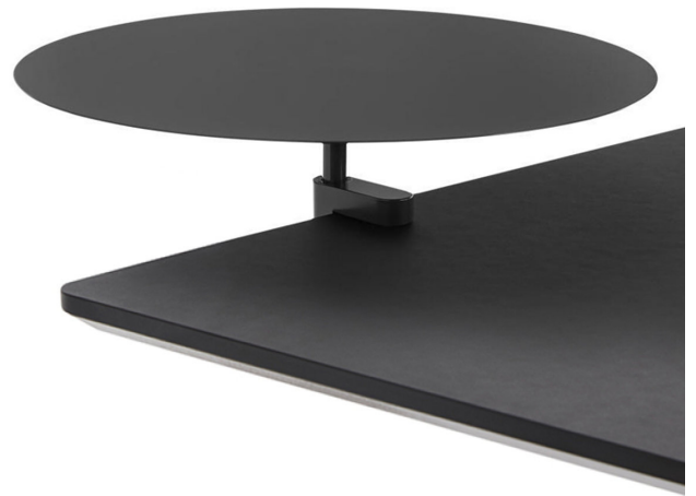
Runder Tisch D380