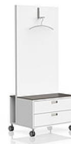
M1 Garderobe mobil