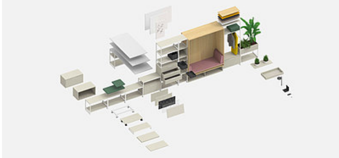
Das System: M1