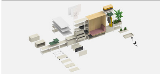
Das System: M1