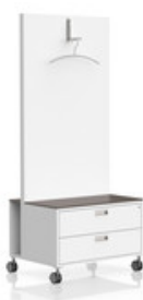
M1 Garderobe mobil