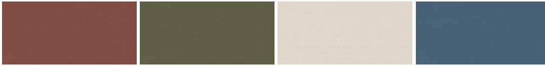
roströt U335 ST9