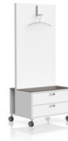
M1 Garderobe mobil