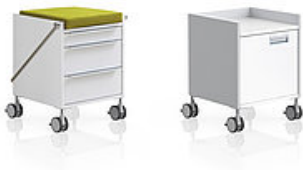
VERSA H MiniCaddy