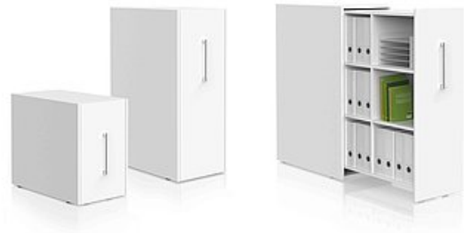
VERSA P Apothekerschrank