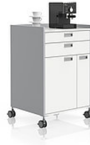
VERSA H KaffeeCaddy