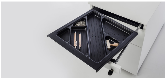
Auszug Materialschale, herausnehmbar