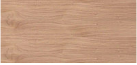
Nussbaum amerikanisch natur