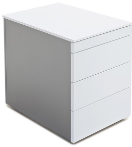
grifflos (Fronten mit seitlichem Überstand)