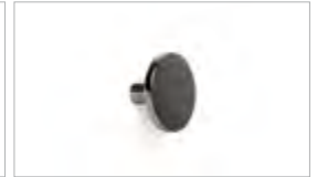
polished titanium black