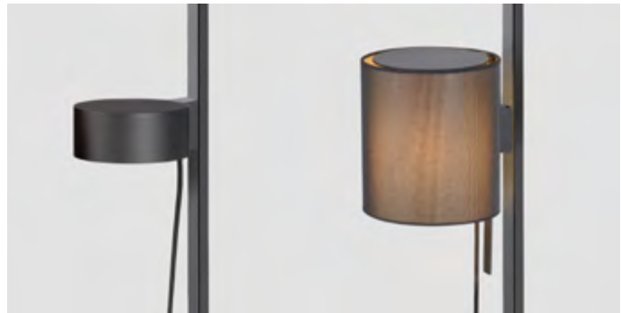
magnetische Leuchte LIFT und LOFT