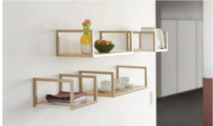
Wandhängende Rahmenelemente H 200 mm, T 300

Mit zahlreichen Farbvarianten lassen sich die Fronten, Korpen und Arbeitsflächen der M1-Küche individuell gestalten: vornehm-dezent in gedeckten Farben wie diamant, agave oder misty blue, bunt-experimentell in Hinguckerfarben wie curry oder rostrot oder eben klassisch-zeitlos in weiß oder Grau- und Beige-Tönen.